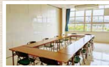
会議室は少人数からご利用いただけます

市民公益活動をおこなうには、メンバーで集まって話し合ったりすることや、活動に参加してもらうために、広く知ってもらうことが欠かせません。そのために、当センターでは、会議室(20~40名)、セミナー室(最大60名)をご利用いただけます。また、事務所として使っていただける専有個室(貸事務ブース3,500円~7,800円/月)やスタッフに相談できる相談室もあります。「チラシを作って、配りたい」というときは、自作のチラシを印刷機でたくさん印刷していただけます。