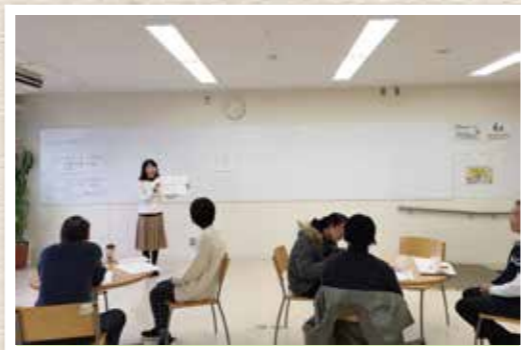
市民活動についての勉強会を開催することもあります

「NPO」とひとことであっても、法人格を持つNPO法人だけではなく、ボランティア団体や、みなさんにも身近な地域会議や町会など、「みんなで地域をよくしよう!盛り上げよう!」という人の集まりも含まれます。市民公益活動支援センターでは、人が集まって話し合う場・活動する場所の貸し出し・ためになる情報の提供など、市民公益活動を側面から応援しています。