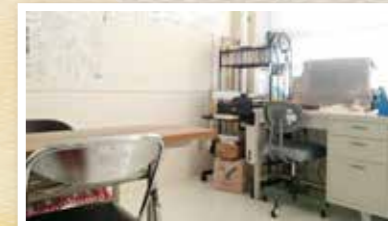
貸事務ブースご利用の一例です