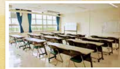
セミナー室は最大60名様までご利用いただけます